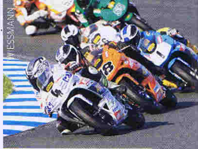
ADAC Junior Cup: Plätze frei